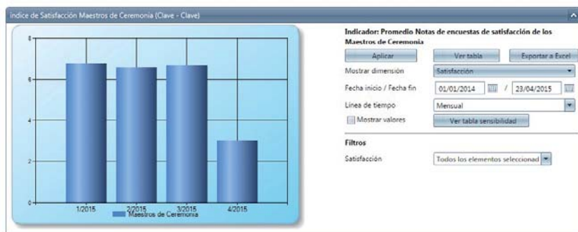
Interfaz de la plataforma Qualiteasy Progress 6.21

- ¿Qué Departamento de la empresa ha generado más no conformidades en el último trimestre? ¿y acciones correctivas?