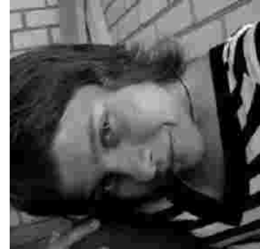
Wind Radviliškis/Šeduva (Lituania)