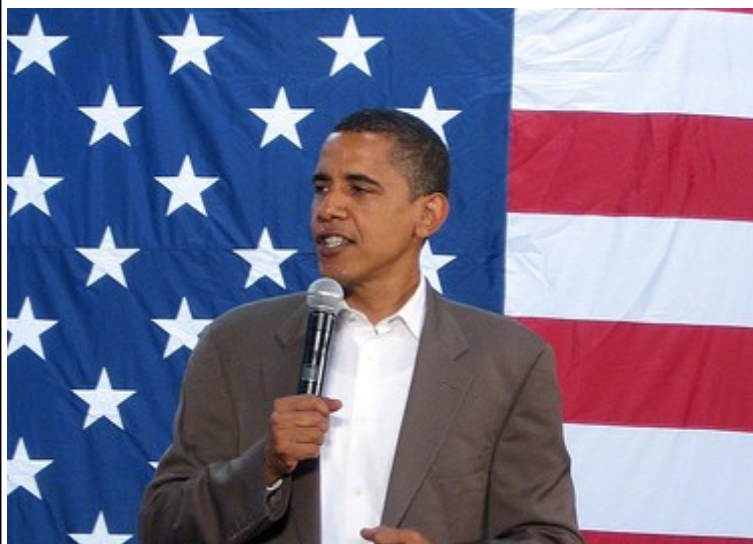
Barack Obama

«Oggi mi trovo di fronte a voi, umile per il compito che ci aspetta, grato per la fiducia che mi avete accordato, coscienti dei sacrifici compiuti dai nostri avi...». Inizia così il discorso di Barack Hussein Obama, pronunciato nel giorno in cui, dopo aver giurato sulla Bibbia di Lincoln, diventa ufficialmente il nuovo Presidente degli Stati Uniti d'America. Di fronte a oltre 2 milioni di persone arrivate a Washington da ogni parte degli U.S.A., il nuovo Presidente ricorda a tutti che «...ci troviamo nel mezzo di una crisi...» e non dimentica quella economica che investe tutto il mondo: «...La nostra economia si è fortemente indebolita, conseguenza della grettezza e dell'irresponsabilità di alcuni...». La speranza è una delle parole chiavi nel discorso di Obama. Crede in un mondo migliore di quello odierno, senza alcuna discriminazione; infatti «...è venuto il momento di riaffermare il nostro spirito tenace, di scegliere la nostra storia migliore, di portare avanti quel dono prezioso, l'idea nobile, passata di generazione in generazione: la promessa divina che tutti siamo uguali, tutti siamo