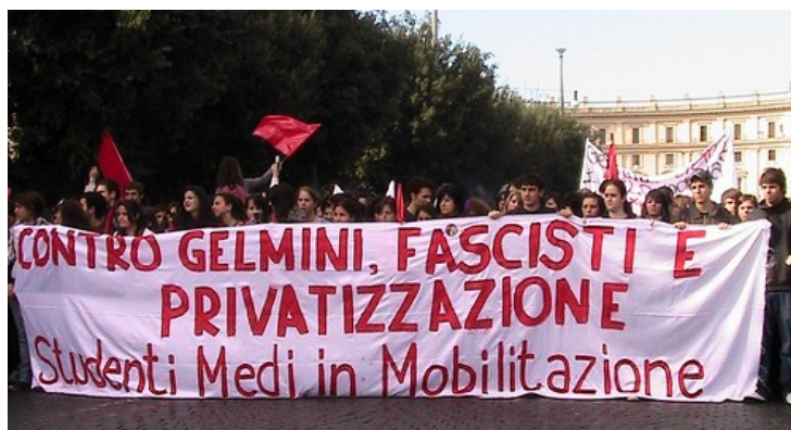
Una manifestazione dell'Onda. Questa e altre immagini delle proteste contro la legge 133 sono presenti sull'album fotografico del progetto Officina sdc sul sito Flickr

Il rettore ha inoltre annunciato che «alcuni giorni fa il senato accademico della Sapienza ha integrato l'articolo 12 della Carta dello studente con una norma in cui si specifica che verranno individuati degli spazi che potranno essere gestiti dalle liste che alle ultime elezioni delle rappresentanze studentesche hanno ottenuto più del 5% di preferenze». Si tratta di una decisione che potrebbe creare nuove tensioni, dal momento che alle elezioni studentesche l'affluenza fu