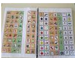
Plafó de comunicació,