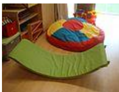
Pufs i hamaques.