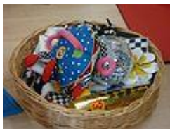
Objectes de contrastos visuals