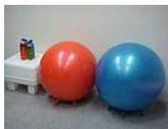
Pilotes de diferents mesures.