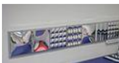
Mirall : fa possible treballar diversos aspectes visuals, el coneixement del propi cos i permeten crear un imatge positiva d'un mateix.