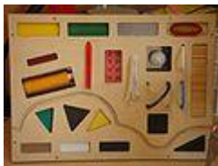
Panell de diverses textures.