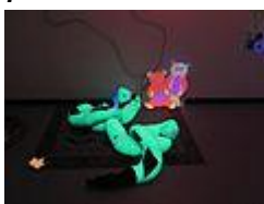
Llum ultraviolada : serveix per intentar captar l'atenció dels usuaris, a través dels colors que brillaran d'una manera peculiar.