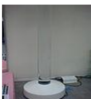
Columnes de llum i bombolles : l'efecte òptic que produeixen les bombolles al canviar de color capten molt l'atenció dels usuaris. Així mateix, el moviment ascendent de les bombolles afavoreix la relaxació