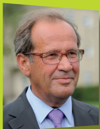
Yves Rome Sénateur Président du Conseil général de l'Oise

Il était une fois un projet ambitieux. Inimaginable diront certains.