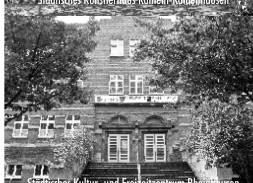
Städtisches Kultur- und Freizeitzentrum Rheinhausen