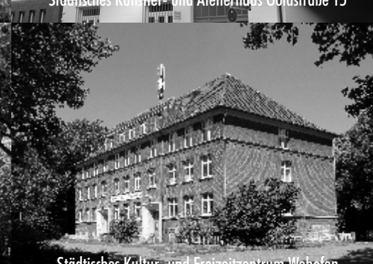
Städtisches Kultur- und Freizeitzentrum Wehofen