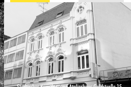
Städtisches Künstler- und Atelierhaus Goldstraße 15