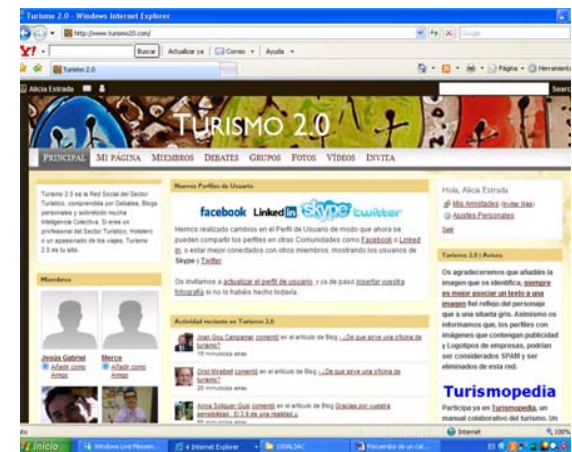
Alicia Estrada. "Del 2.0 al 3.9" Cata en Abadal