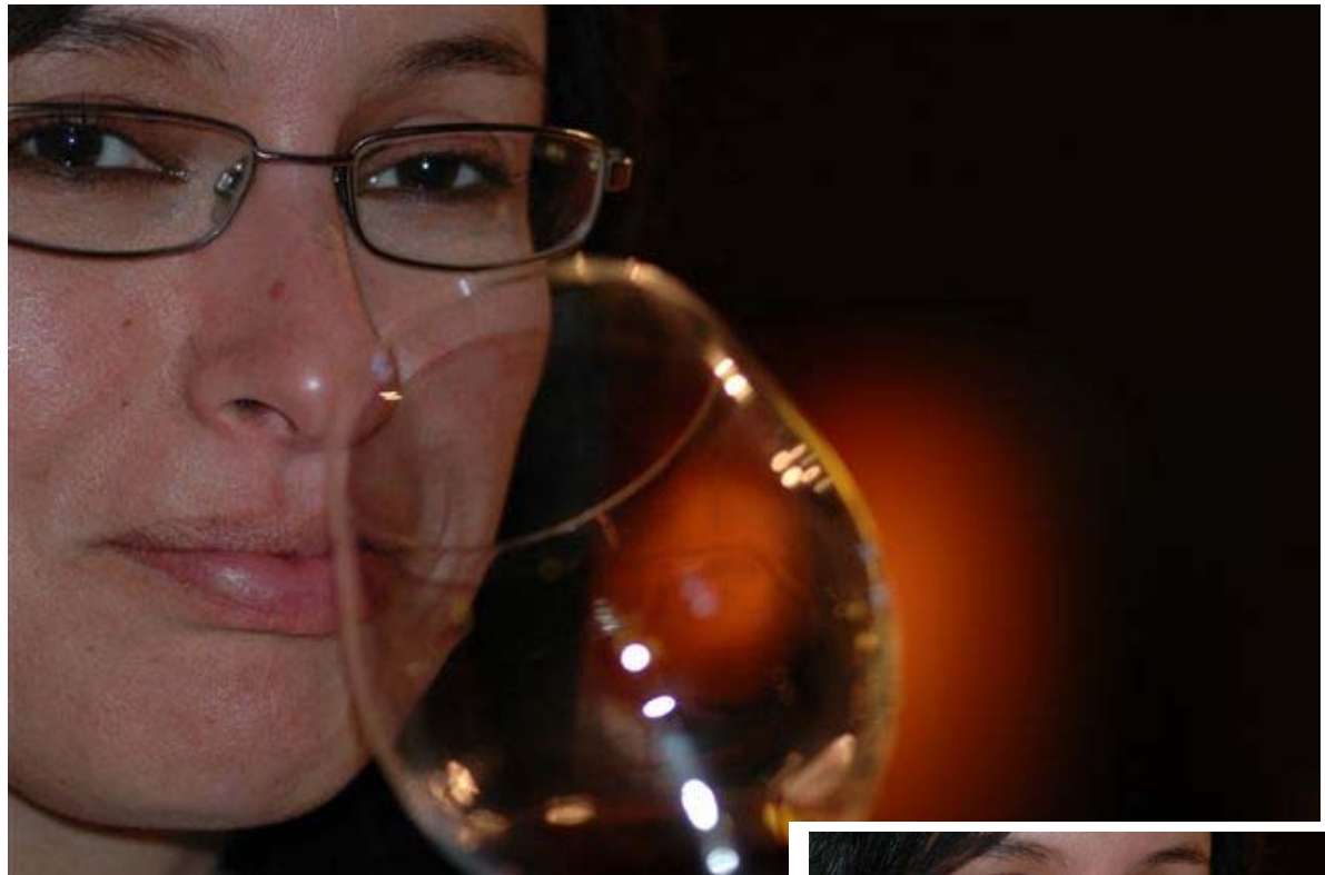
Angels catando en ABADAL. Descubriendo amigos y vinos.

Maridaje: Ideal para carnes blancas, fiambres, arroces, pastas, pescados grasos