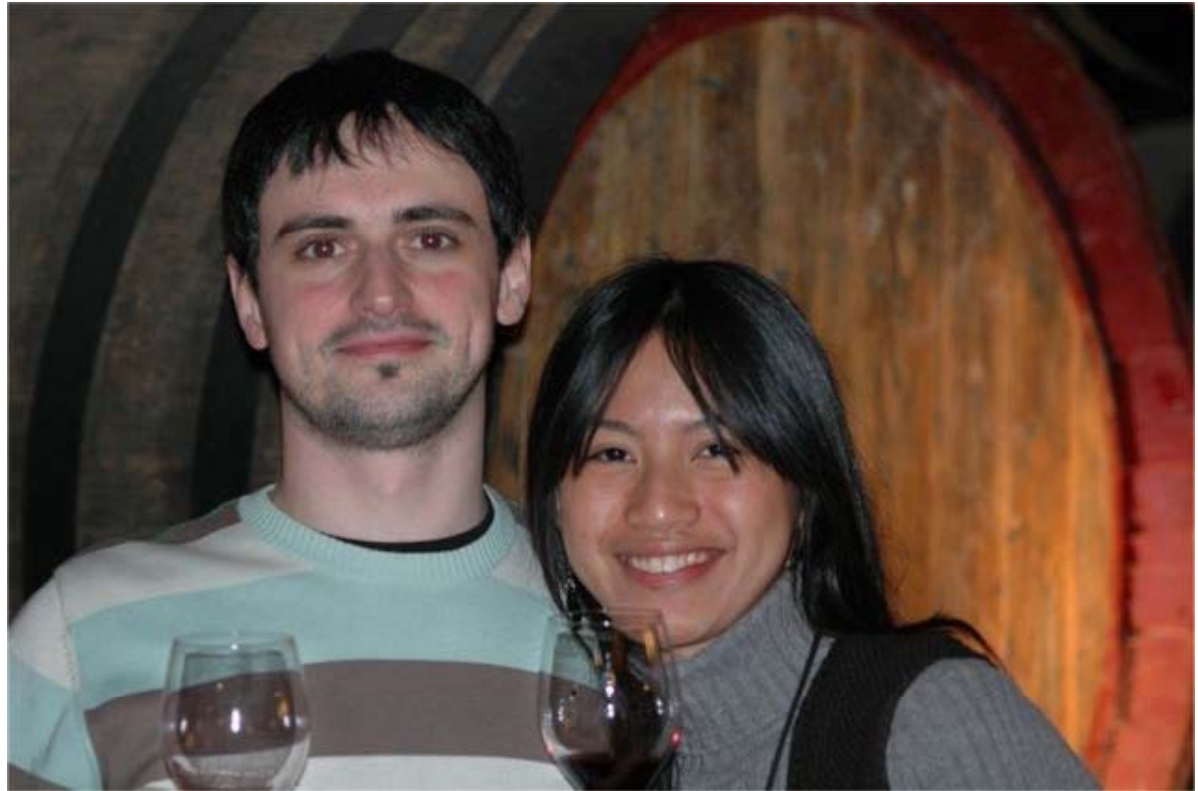
El capítulo internacional de la jornada “Del 2.0 al 3.9”. Los representantes italiano y filipina.