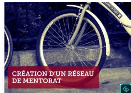
Création d'un réseau de mentorat