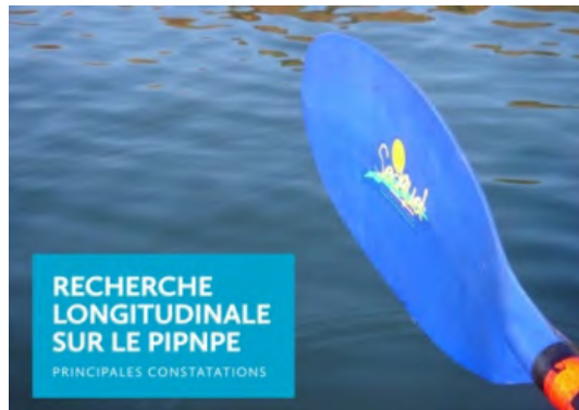
Recherche longitudinale sur le PIPNPE - Principales constatations