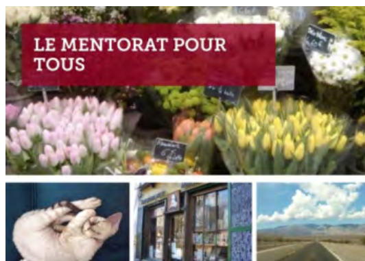
Le mentorat pour tous