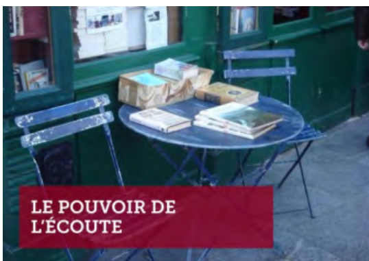
Le pouvoir de l'écoute