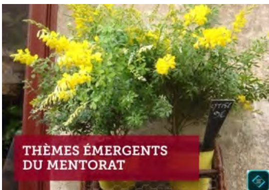
Thèmes émergents du mentorat