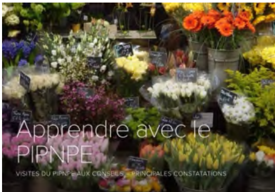
Visites de PIPNPE aux conseils - Principales constatations

Depuis quelques mois, la DPNME utilise l'appli Adobe Slate pour produire de brefs récits visuels qui racontent ce que nous avons appris sur le mentorat. Cliquez sur l'une de ces présentations dans le tableau ci-dessous ou voyez-les toutes à l'adresse http://mentoringmoments.ning.com/group/mentoring-mentors/page/glideshows