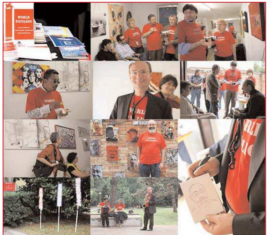
"Mix di immagini dal World Pavilion"

Dall' Introduzione del Catalogo del WORLD PAVILION Milena Milani