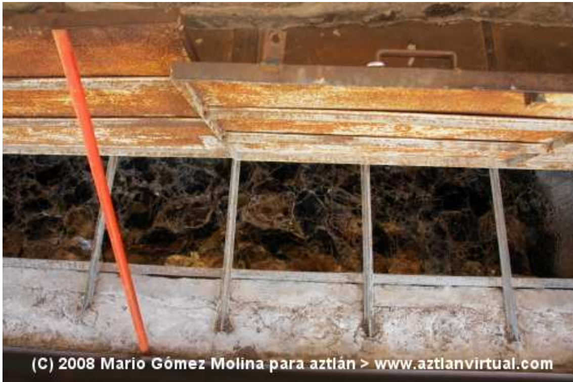
El Templo de la Mica en Teotihuacan fue utilizado seguramente como un antiguo almacén de placas de mica para su posterior distribución a los talleres que la utilizaban.

lo cual los Mayas de Copán establecieron algún tipo de comercio con otros Mayas para poder conseguir ese preciado material.