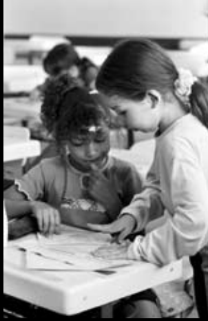
Porto Alegre (Brasil)

Fills de pares enfrontats en la guerra, ens recorden la importància de l'amistat per sobre de les diferències de tipus cultural o religiós.