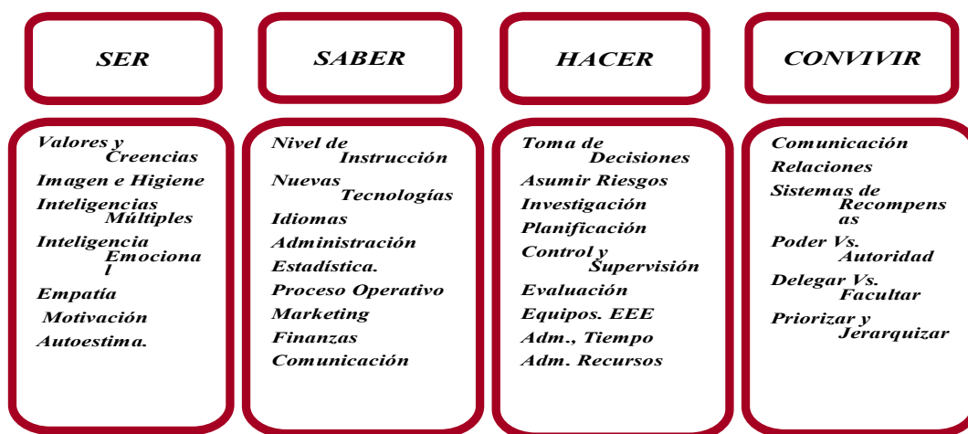
Cuadro No.2 Visión Holística del Rol del Gerente

Las Tendencias gerenciales modernas hablan del gerente con una visión o sentido holístico, donde se establece el Ser, el Saber, y el Hacer para un mejor Convivir. (Ver Cuadro No. 2)