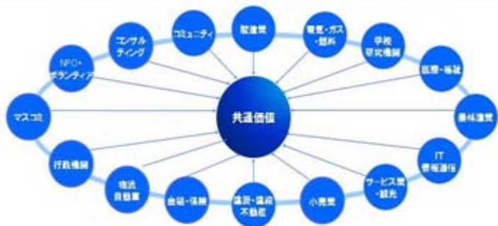
< 5つのコアエンジン >

法人会のビジネスマッチング「バリューアップ交流会」2013年度、第2弾を開催致します！従来の「名刺交換型」や「ブース設置型」ではない、自社の価値を参加者全員で再発見してゆくという新しいスタイルをご体験下さい。「省エネ」、「節電」、「補助金」、「金融」、「医療福祉」、「農業」など、旬のトレンドをテーマに様々な気づきと有機的な連携を生み出します。