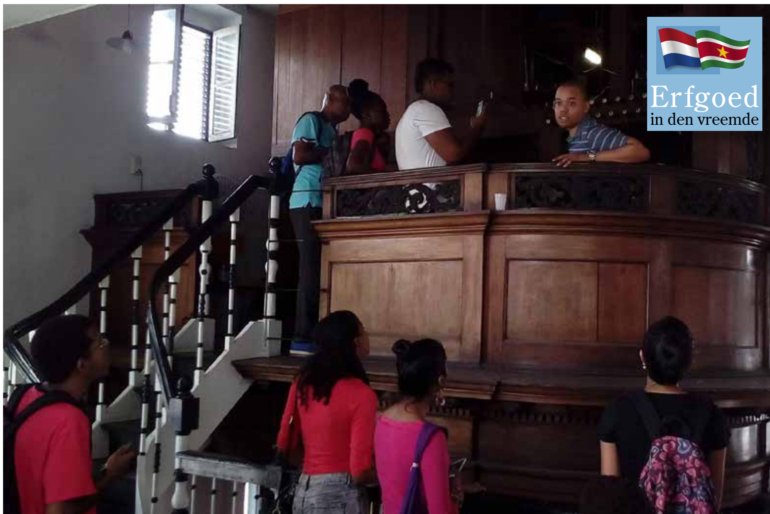
STUDENTEN VAN DE ANTON KOM UNIVERSITEIT BIJ HET ORGEL IN DE CENTRUMKERK.

te vergroten werken culturele en erfgoedorganisaties aan de oprichting van de Vereniging Klinkend Erfgoed Suriname. Die vereniging wil met educatief materiaal en culturele activiteiten het grote publiek bekend maken met het welluidende verleden.