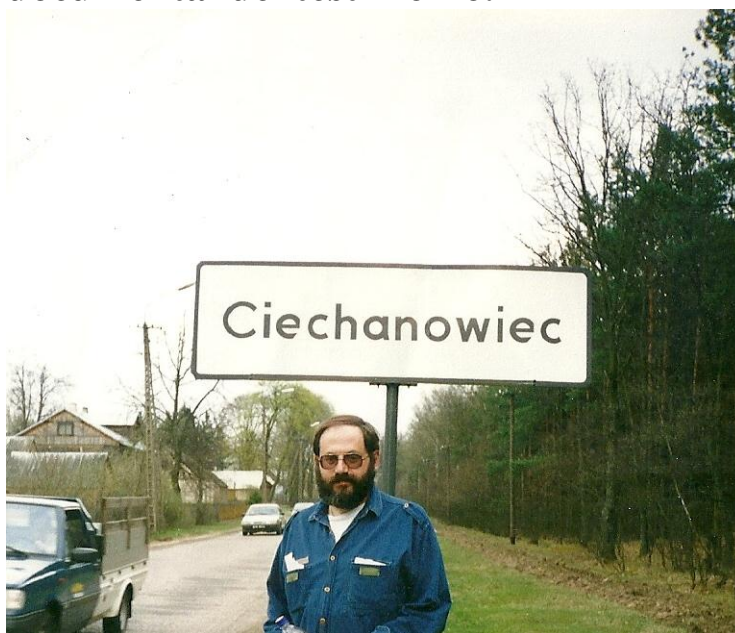
El autor de la nota recorre la zona de los hechos.

Levi reconoció que la capacidad de las víctimas de restituir el pasado es limitada. El tiempo transcurrido, la autocensura y la natural subjetividad del transmisor inciden en la fidelidad documental del testimonio.