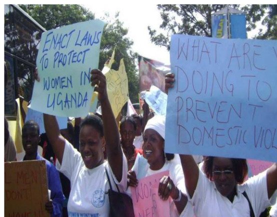
Mujeres manifestándose en Kampala por una legislación en materia de violencia doméstica, que se aprobó como ley en diciembre de 2010

ayudando así a que los gobiernos sean más representativos y rindan cuentas.