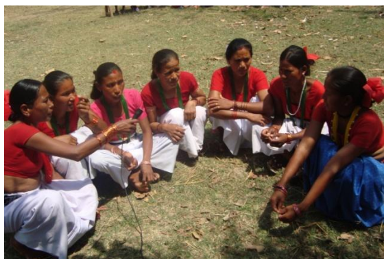
Clase de debate comunitario, Nepal

En Nepal, las clases de debate comunitario (CDC, por sus siglas en inglés) han permitido que las mujeres exploren y desafíen la aceptabilidad cultural de la violencia contra mujeres y niñas/de género y han empezado a ganar el apoyo de sus familias y de los hombres