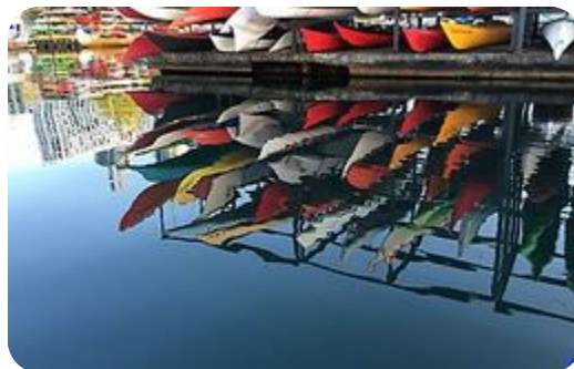
Le mentorat, forme d'apprentissage authentique – Diaporama Adobe Spark