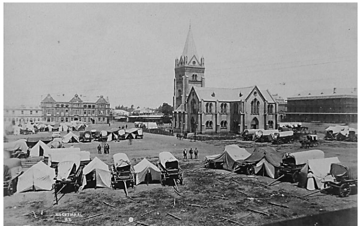
(Nagmaal op Kerkeplein, ca. 1895)