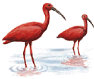
Eudocimus Ruber / Corocora Colorada

La observación de aves en grupo, ya sea organizada o improvisada, requiere de cuidados especiales.