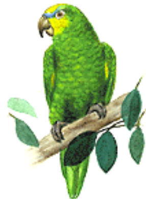
A. Amazonica / Loro Guaro