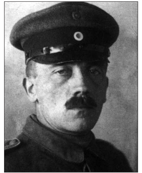
Adolf Hitler 1919-ben

A Köztársaság Németországban a születését nem népünk egységes nemzeti akaratának köszönheti, hanem számos ravaszul értékelt körülménynek, amelyek összefoglalva egy mély általános elégedetlenségben nyilvánultak meg. Ezek a körülmények azonban függetlenek voltak az államformától és még ma is hatnak. Sokkal jobban, mint korábban. Így már népünk egy nagy része is felismeri, hogy nem a megváltoztatott államforma, mint olyan, változtathat és javíthat helyzetünkön, hanem csak a nemzet erkölcsi és szellemi erőinek újjászületése.