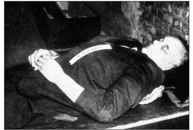
Alfred Rosenberg holtteste Nürnbergben

Annak, aki bevezetést ír egy másik ember művéhez, nem az a funkciója, hogy felvázolja annak a műnek tartalmát és érveit. Még kevésbé az a funkciója, hogy elemezze és bizonyítsa a szerző szemléletének érvényessége mellett és ellene szóló érveket. Ezért befejezésül röviden: Rosenberg szemlélete szerint a különféle emberi fajoknak faji lelkiségük van. Ezek a faji lelkiségek éppen olyan tartósak és változatlanok, mint a faji fenotípusok – nem jobban, és nem kevésbé. Ezek okozzák a kultúrákat, értékeket, vallásokat és politikai rendszereket, amelyek egyedülálló módon összhangban vannak a kérdéses fajjal és idegenek bármely más faj számára. A fajkeveredés az ilyen kultúrák degenerálódását és elpusztulását okozza, a faji törvénytelenység egyfajta skizofrén állapotot jelent. Árja ember hozta létre az ősi India, Perzsia, Görögország, Róma és valószínűleg Egyiptom összes nagy civilizációját, és végső soron mindegyik a fajkeveredés miatt degenerálódott és pusztult el.