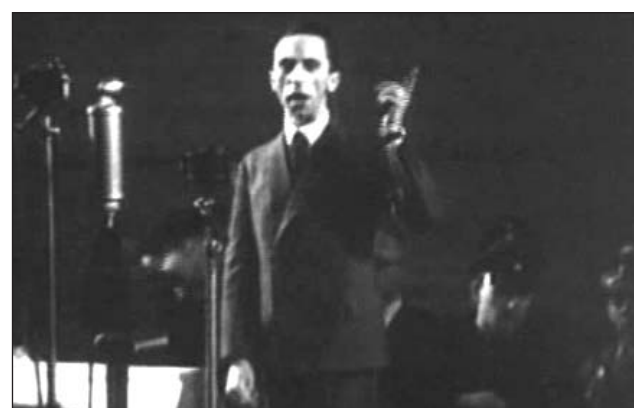
Dr. Goebbels figyelmezteti a zsidó sajtót

És ha a zsidó újságok ma még azt hiszik, hogy rejtett fenyegetéseiken keresztül a nemzetiszocialista mozgalmat megfélemlíthetik, ha azt hiszik, hogy a szükségintézkedéseinket