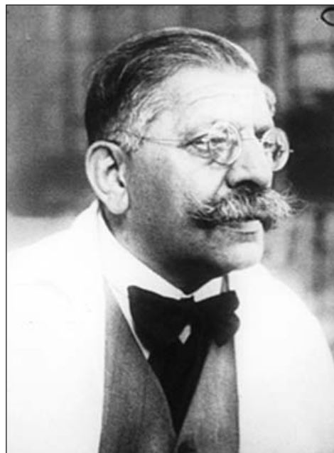
Magnus Hirschfeld, a zsidó szexuális „reformer” és „kutató”

Egy nép, amely azzal a feladattal szembesül, hogy évente 1,5 millióval emelje a születések számát, nem engedheti meg magának azt a luxust, hogy apáinak nagy arányát nélkülözze, csak azért, mert áldozatul estek egy több évtizedes, akadályozatlan lemorzsolási taktikának, amely a német nép egészsége ellen irányult. Ez a megfontolás meghatározta a politikai feladatot, amelyet teljesíteni kell a faji közösség érdekében. A feladatot mindenekelőtt azon „szakértők megállapításaira” való tekintettel világították meg, akik e mérték „kóroktanán és tünettanán” törttek a fejüket. E területen a külső „szakértők tudományos ismerete” – akár Kraft-Ebing, Schrenk-Rotzing, akár Magnus Hirschfeld szakvéleményét kérjük – mindig azon a feltevéseken alapul, hogy a homoszexualitás öröklött, vagy mindenesetre rendellenesség: a különböző szakértők csupán a „rendellenesség” feltételezett okaiban mondanak egymásnak ellent.