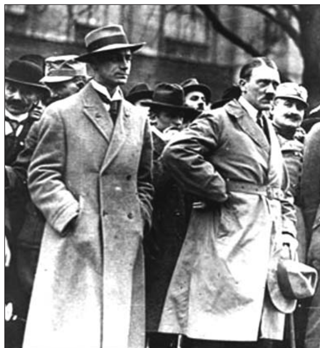
Rosenberg és Hitler 1923 novemberében

De Rosenberg ellentéte a katolikusokkal nem volt egyszerűen vagy kizárólagosan teológiai téma. Németországban volt egy hatalmas katolikus politikai párt, a Centrum Párt. Még Bismarck is a XIX. században a németországi politikai katolicizmusban látta a veszélyt a nemzet belső békéje és újonnan megteremtett egysége szempontjából. Emlékeznünk kell arra, hogy a Második Birodalom, amely 1871 januárjában született, és 1918 novemberében szűnt meg, sohasem volt erőteljesen központosított állam. Négy királyságból (Poroszországból, Bajorországból, Württembergből és Szászországból), öt nagyfejedelemségből, tizenhárom fejedelemségből, három szabad városból állt. Elzász-Lotaringia birodalmi területe csupán álom volt, amelyet csak három rövid, de keserve háború volt képes realizálni. Bajorország, Württemberg és a Rajna-vidék túlnyomóan katolikus volt. Elszakadási tendenciák mindig fenyegettek a felszínen a Franciaország által bátorított válság idején, leg-