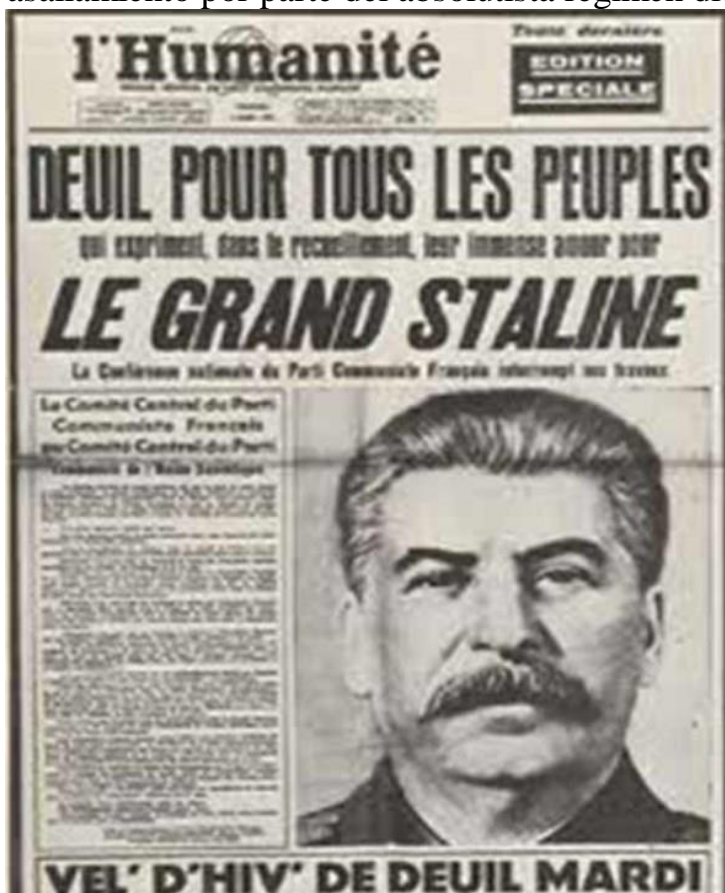
l'Humanité, París, 1953

Jean Paul Sartre consideraba que la condena de la estructura dogmática y represiva de la órbita soviética debía sostenerse en una firme y unívoca fidelidad al ideal revolucionario que motorizó la creación de un polo socialista alternativo a las potencias coloniales occidentales. Albert Camus rechazaba ese condicionamiento de Sartre y se afirmaba en el sentido ético de las ideas de justicia y libertad, rechazando su avasallamiento por parte del absolutista régimen dictatorial.