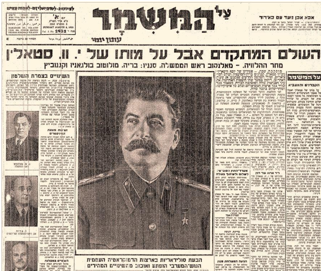
Portada del matutino de MAPAM, Al Hamishmar: duelo por muerte de Stalin, 1953.

Yaacov Jazan, uno de los dirigentes de mayor influencia ideológica en el Hashomer Hatzair, se refiere en aquella época a la solidaridad del movimiento con la URSS: en el Vaad Hapoel (Consejo Ejecutivo) del Kibutz Artzi, assera que "las políticas soviéticas niegan los principios básicos de la Revolución de Octubre, pero así como nada puede conmocionar nuestra fe en el sionismo como idea emancipadora, tampoco se debilitará nuestra convicción en la necesidad de bregar por un mundo socialista".